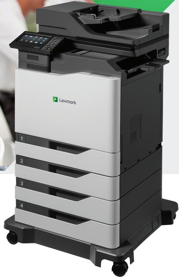
XC6152de mit drei Fächern und optionalem Finisher

Voll ausgestattetes A4- Multifunktionsgerät mit Farbdruck